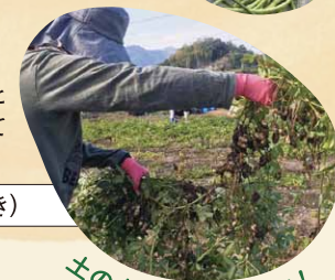
土の中に実がこんなに!