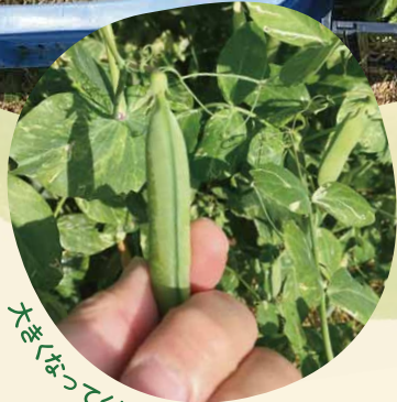
大きくなってきてありがとう!