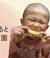
掘りたての金時芋は天ぷら!