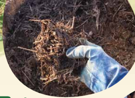
ひと夏を越した 雑草堆肥!

土から生えてくるものは宝物。農薬や化学肥料ではなく、畑の草を根っこごと抜いて、米ぬかをふって発酵させて、自家製雑草肥料にしています。もみがら、くん炭なども堆肥にして土づくりをしています。もちろん除草剤も使わず、草・野菜・土の匂を大切に大好きな野菜を育てています。