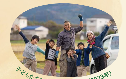
子どもたちも大きくなりました!(2023年)